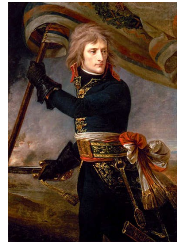
Bonaparte au pont d'Arcole (17 Novembre 1796). Antoine-Jean Gros - 1801

Un an après, Bonaparte est de retour en France.